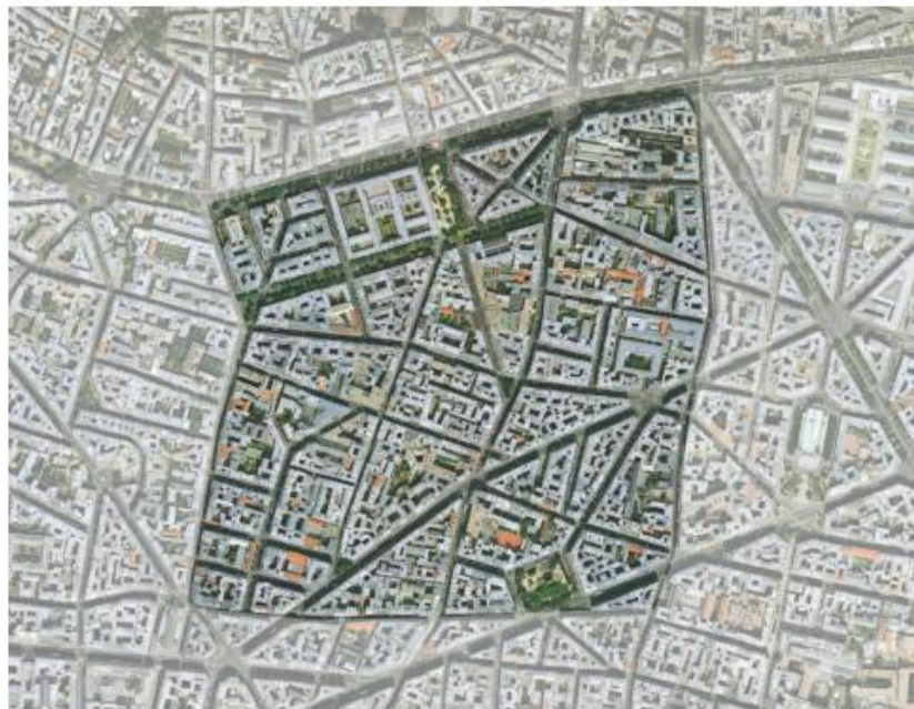
QUARTIER ROCHECHOUART- 9 e