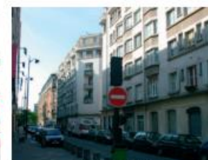
rue de la Roquette