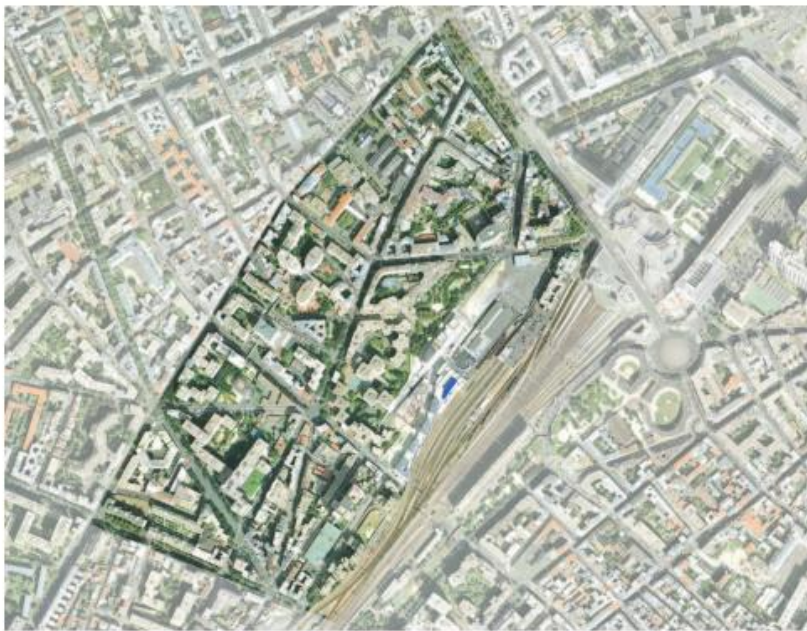
QUARTIER FALGUIÈRE- 15 e