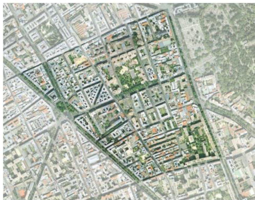
QUARTIER ROQUETTE- 11 e