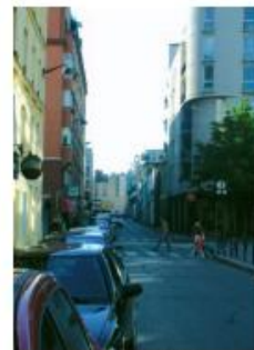
rue du Chevaleret