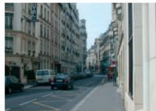
rue du docteur Roux