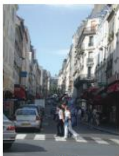
rue des Martyrs