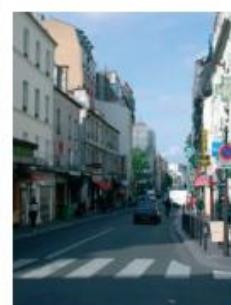
rue de Charonne