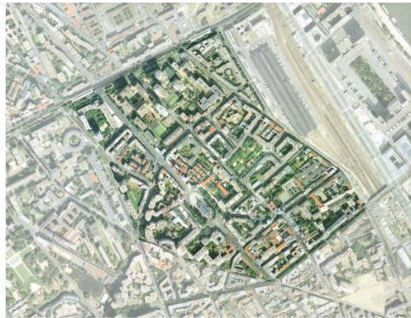
QUARTIER JEANNÉD'ARC- 13 e